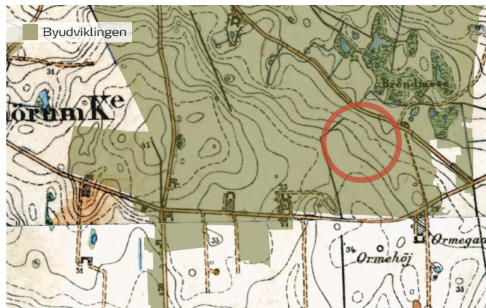
Historisk kort (1842-1899) med udpegning af Smørum Kultur- og Idrætscenter og byudviklingen i Smørumnede.

Bag ved kulturhuset i Smørum ligger der en mindesten for Smørum bønderes drab på 10 svenske soldater under svenskekrigene 1657-1660.