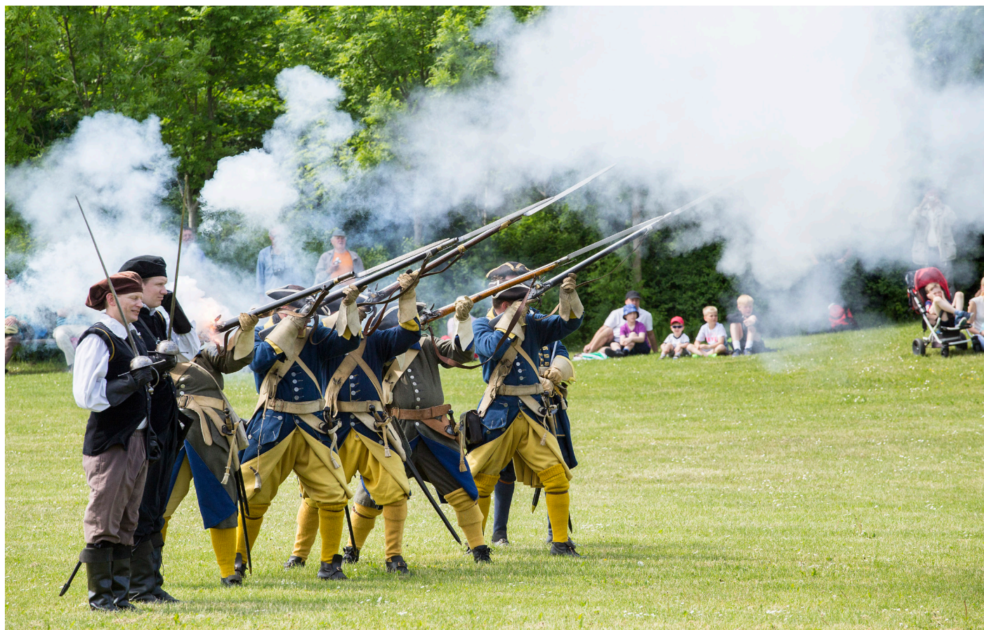
Svenske Slaget i Smørum, hvor en slagscene fra svenskekrigene udspiller sig.

Ved Smørum Kulturhus afholder Egedal Arkiver og Museum hvert år en historisk festival med svenske krigene som tema, hvor der genskabes historiske slagscener fra svenskekrigene.